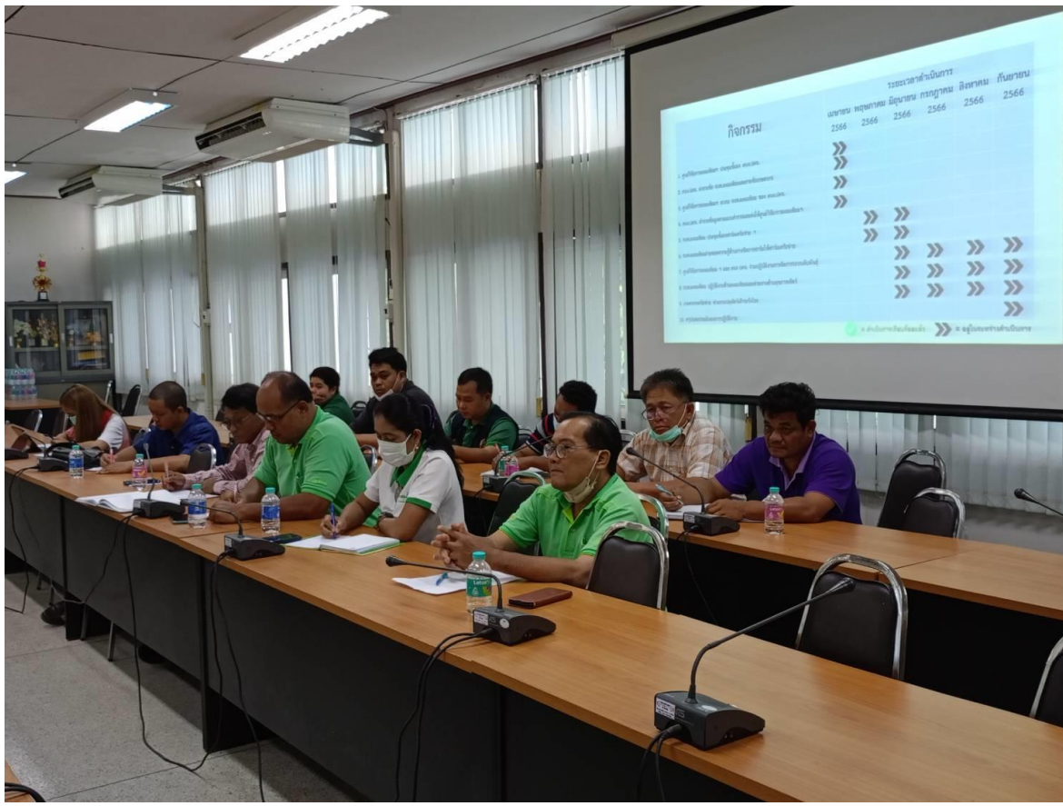
ภาพ : 2.1 ฝึกอบรมชี้แจงเจ้าหน้าที่ผสมเทียม ณ ห้องประชุม สนง.ปศุสัตว์จังหวัดกาฬสินธุ์